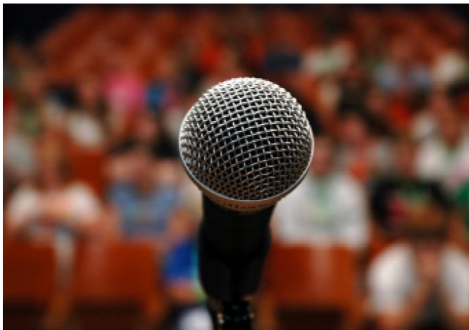
丧失公信力的媒体最终将丢掉话语权

压力下长久不衰的重要因素。对于媒体来说，一旦树立了权威形象，也就可以以其特有的魅力强烈吸引和感染受众，其公信力也将大幅度提高。