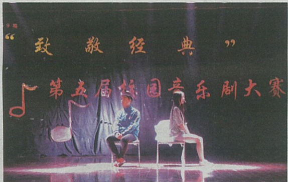
“人鬼情未了”节目现场

时光如东流逝水，一路向前，但我们终会在不经意间静默回首，与经典翩然相遇，与爱深深对视。走在自己的人生路上，我们曾被指教：读万卷书不如行千里路，行千里路不如阅人无数，阅人无数不如名师指路。所谓经典，就是历久弥新，经久不衰的东西。所以，让我们一起回顾经典，体味其中深意。