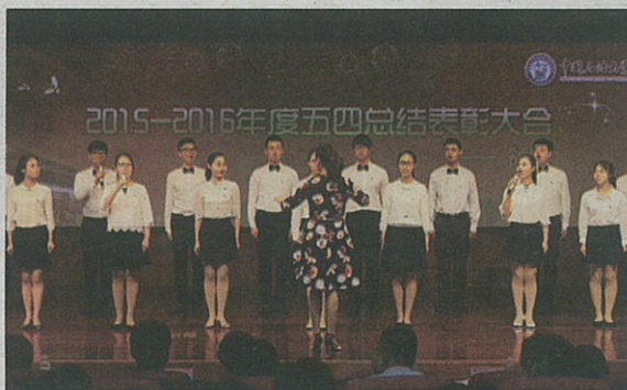
辅导员合唱团合唱