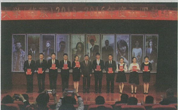
受表彰先进集体和个人领奖