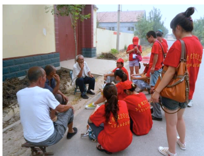
实践队听大杜村老人讲吕剧的故事

今年暑假，“声声不息”实践队深入吕剧发源地——山东省东营市牛庄镇，在实践中走访了多个吕剧文化发展社区、村庄，收集、整理、分析了自吕剧创始以来的部分经典剧目，准备通过后期的研究，建立起较为完整系统的吕剧文化资源数据库，更为深入地了解和推广吕剧。