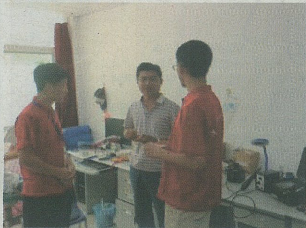
实践队员们正在进行实地调研

向阳花公益助学团：华桥基金会“走向西部”项目资助 标语：“架起一座桥，打开一扇窗”——助力边远山区教育发展，浇灌贫苦孩子求学希望。