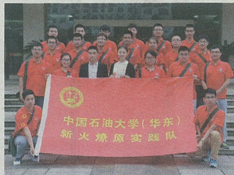
实践队员在基地前留影

井冈山的油灯成了革命的指明灯,它在茫茫的黑夜中,指引着我们前进的道路。努力学习革命先烈精神,胸怀理想、