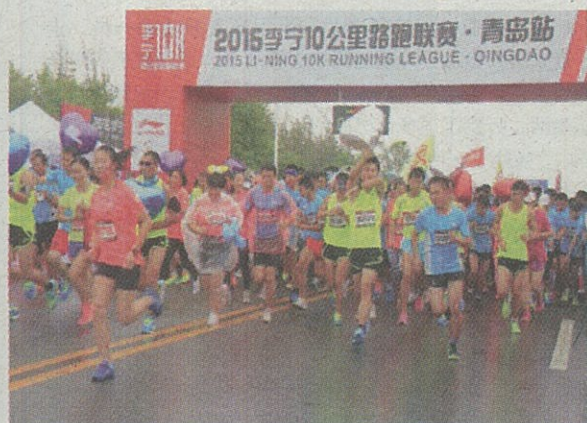
2015 李宁 10 公里路跑联赛·青岛站