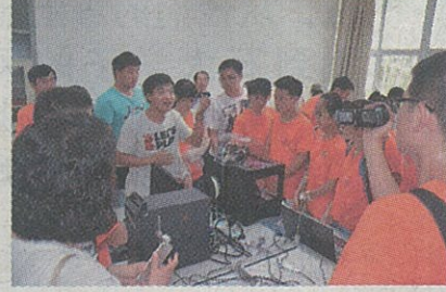
实践队员参观学校校史馆与实验室