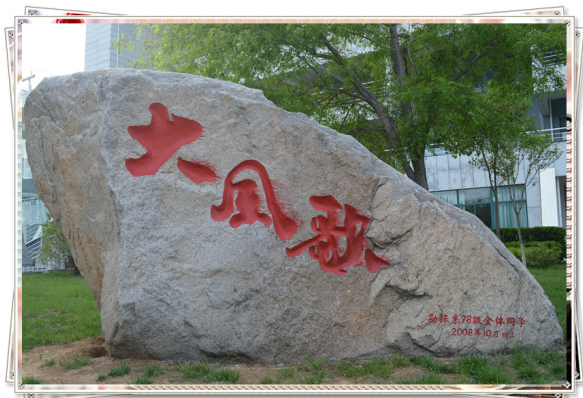
学校景观石“大风歌”（勘探系78级全体同学赠）借汉王刘邦《大风歌》“大风起兮云飞扬，威加海内兮归故乡，安得猛士兮守四方！”讴歌茫茫大漠中石油勘探人的英雄气概和豪迈人生，体现了对母校的深爱之情！